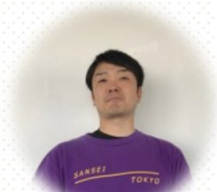
Web サイト制作者：梶翔馬