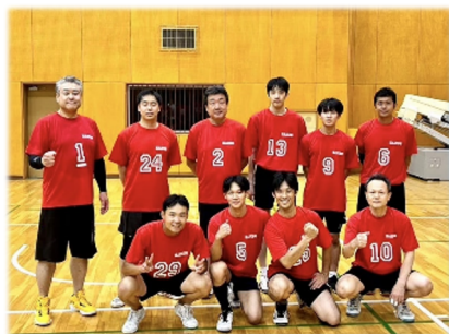
Bコート優勝 ハンズ