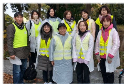
6km 付近でコース整備員に従事した理事