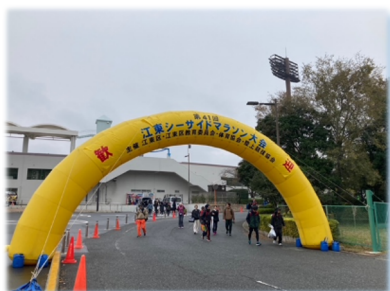
スタート&ゴールの夢の島陸上競技場

11/26(日)小雨が降るなか第 41 回江東シーサイドマラソン大会が開催されました。バレーボール連盟から 2 名のスポーツ推進員が給水主任・表彰担当として、10 名の理事がコース整備員ボランティアとして参加しました。