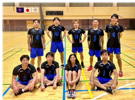
準優勝 ともえクラブ