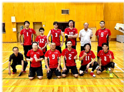
Aコート優勝 つくサン倶楽部

10/1(日)スポーツ会館にて秋季大会、一般9人制(男子・女子)が開催されました。 男子7チーム、女子3チームが参加。フルセットやデュースが多い白熱した大会となりました。