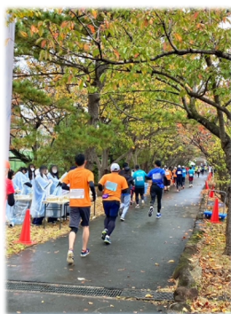
11km 給水付近の新木場緑道