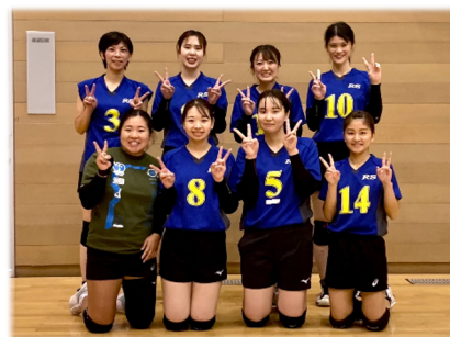
優勝 RS クラブ