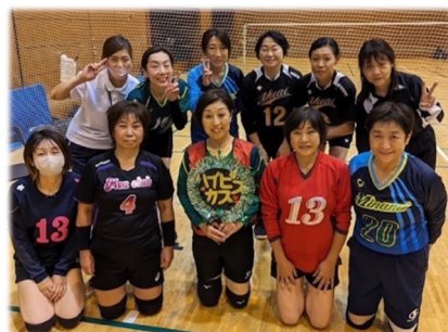
準優勝 ハイビスカス