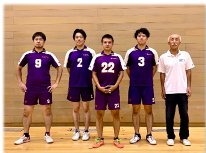
Aコート優勝 三省クラブ

9/18(祝)有明 SC にて秋季大会、一般6人制(男子・女子)が開催されました。 男子7チーム、女子2チームが参加。